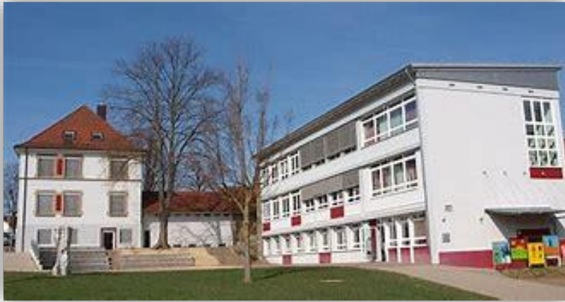
Hans Suter Schule